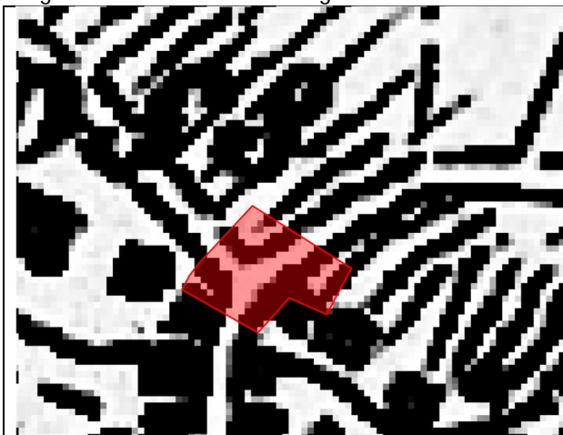
Abbildung 1: Dufourkarte ca. 1851, 1:100'000

Der Bereich der untersuchten Parzelle ist im ältesten Kartenwerk der Schweiz (der Dufourkarte) aus dem Jahre ca. 1851 bereits eine Strasse zu erkennen. In der Siegfriedkarte von 1883 ist die Böschung in Richtung Strasse kartiert und der grobe Verlauf des Geländes aus den Höhenlinien ersichtlich.