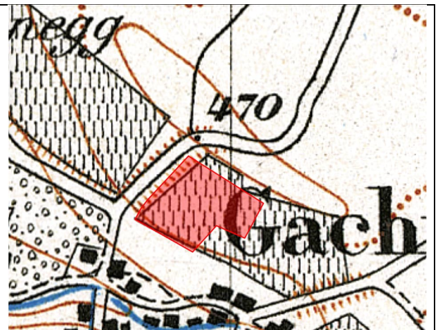
Abbildung 2: Siegfriedkarte 1883, 1:25'000 (Äquidistanz 10m)