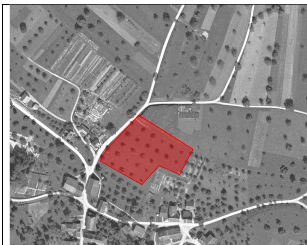
Abbildung 4: Luftbild 1935