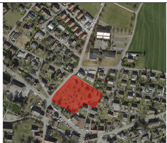
Abbildung 5: Luftbild 2025